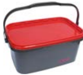
Im praktischen Kunststoffbehälter